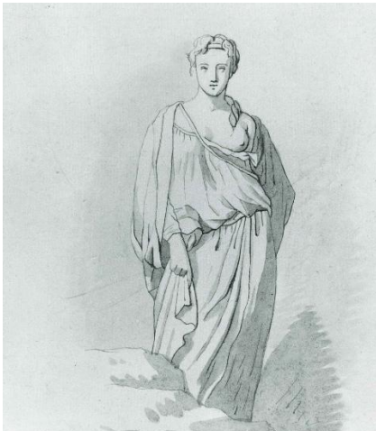
Tekening van M. Burman uit 1786

weer teruggekomen zijn, is niet bekend. Volgens dit artikel heeft deze beeldengroep ongeveer drie eeuwen in Gasselte gestaan.