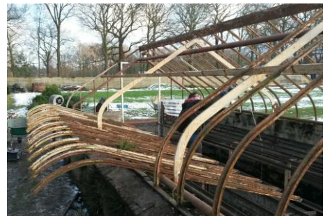
Foto links: de muurtjes van de kas zijn al weer opgemetseld en de plavuizen zijn op de bodem gelegd.

Foto rechts onder: De zinken waterbak achter in de Orchideeënkas is beschadigd en moet vervangen worden.